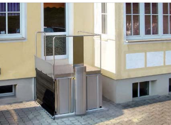
Überdeck-Lift mit Nutzung der Haustür zum Verschluss der oberen Fahrbahn im Außenbereich

Mit dem Lift LM können Gehbehinderte oder Rollstuhlfahrer Höhenunterschiede bis zu 1 m/1,3 m selbständig überwinden. Der Lift ist sehr gut geeignet für den nachträglichen Einbau innen wie aussen.