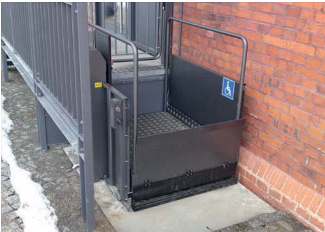
Durchfahrer mit Außenrufer und oberer Tür in lackierter Ausführung