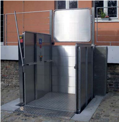
Lift für Absatzhöhe bis 1,3 m mit oberer Tür und Sicherheitschranke