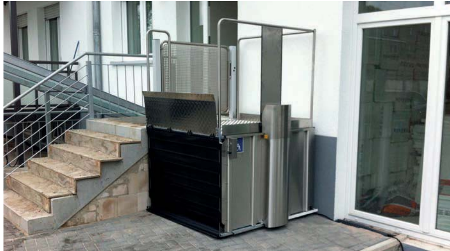
Hublift mit Tür auf der oberen Fahrbahn und Zugängen über Eck