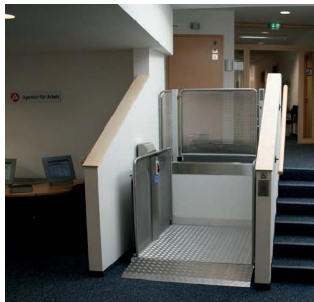
Hubbühne mit Tür zum Verschluss der oberen Fahrbahn