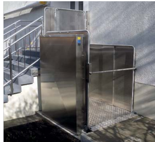
Senkrechtlift bis 1,3 m, obere Tür mit Lochblechfüllung