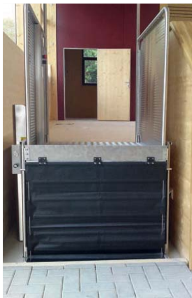
Senkrechtlift im Innenbereich mit Sicherheitsbügel